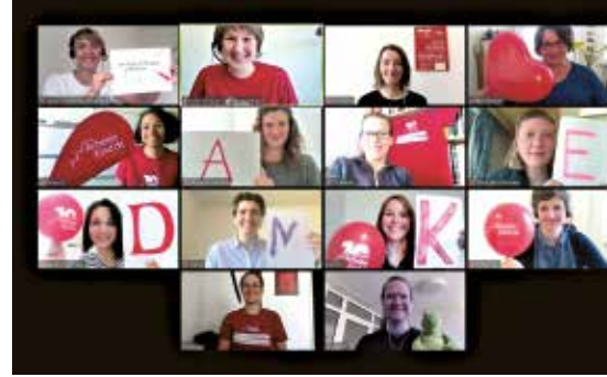
Virtuelles offenes Treffen von ArbeiterKind.de Augsburg | Dankesgruß an die Ehrenamtlichen vom ArbeiterKind.de-Hauptteam

„Die aktuelle Lage ist die beste Chance zu zeigen und zu beweisen, dass wir immer - egal, wie schwer es ist - für unsere Ratsuchenden und füreinander da sind. Die stabilsten Brücken bewähren sich schließlich erst in den stürmischsten Zeiten.“